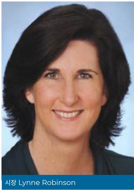
시장 Lynne Robinson

때보다 하나로 뭉쳤습니다. 이곳에는 공동체와 협력, 희망이 있습니다. 이제 조금씩 끝이 보이고 있지만 결승점을 성공적으로 통과하기 위해 우리는 주지사의 지침을 계속 따라야 합니다.