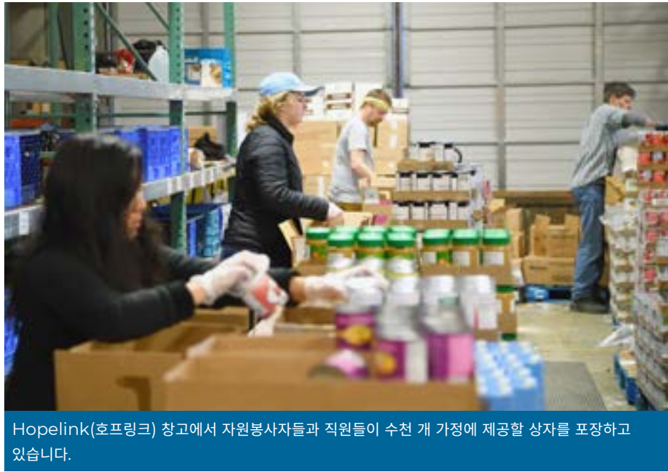
Hopelink(호프링크) 창고에서 자원봉사자들과 직원들이 수천 개 가정에 제공할 상자를 포장하고 있습니다.

코로나 19 발생으로 학교와 많은 기업들이 강제 임시 휴교와 휴업에 들어가면서 대규모 폐쇄 상황을 극복하기 위한 지역사회 자원에 대한 필요성이 대두하고 있습니다.