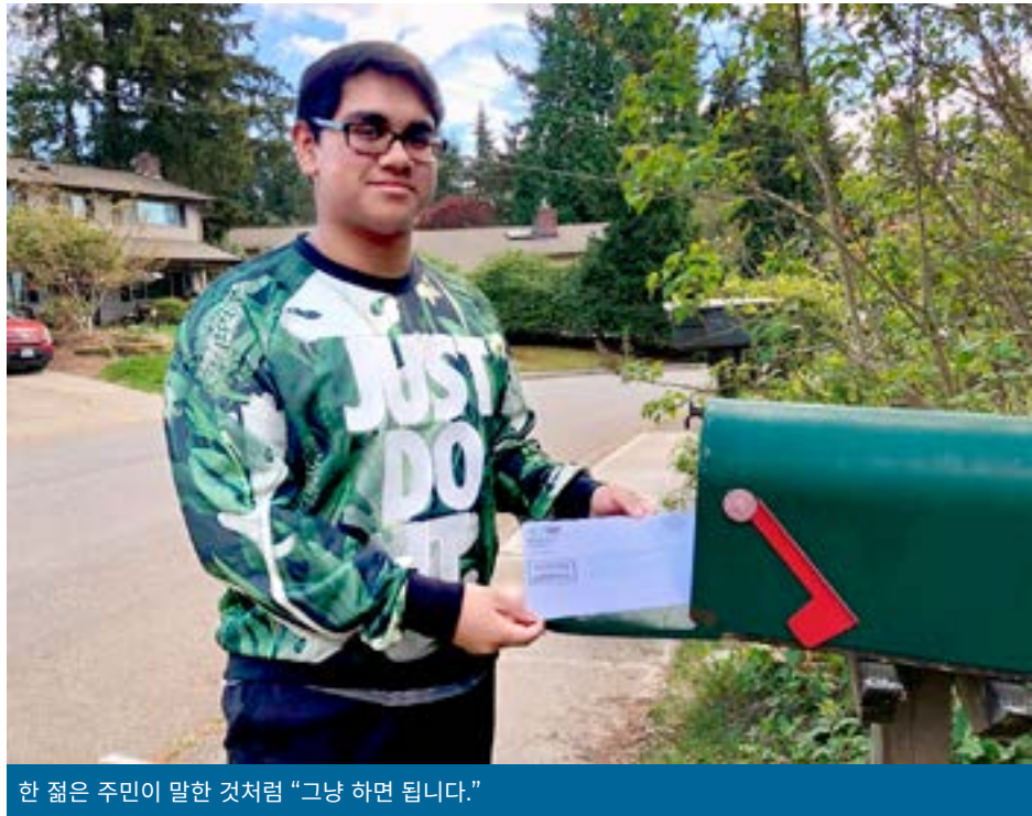
한 젊은 주민이 말한 것처럼 “그냥 하면 됩니다.”

전국의 도시들은 코로나 바이러스로 인하여 얼마나 많은 주민이 금전 또는 건강 문제에서 위기를 겪고 있는지 추정하고 있습니다. 정확한 추산을 통해 도시들은 복구에 필요한 자원과 계획을 효과적으로 마련할 수 있습니다.