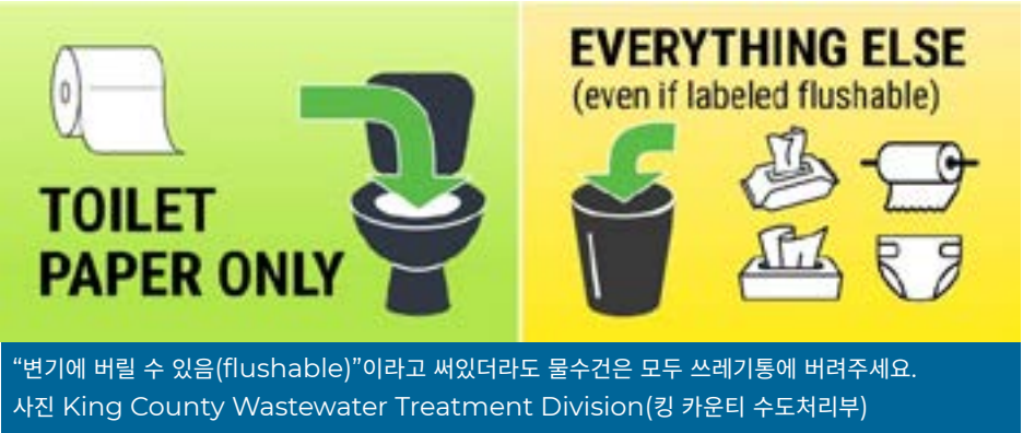
“변기에 버릴 수 있음(flushable)”이라고 써있더라도 물수건은 모두 쓰레기통에 버려주세요.

작업자 규모, 근무조의 변경, 원격 근무 전환에도 불구하고 많은 주민들은 서비스 수준의 차이를 느끼지 못할 것입니다. 공공서비스 행정 전화 (425-452-6932)에 전화를 건 고객은 직원이 외부에 있기 때문에 응답 지연을 경험할 수 있지만, 언제나 주민이 이용할 수 있으며 24시간 비상 지원을 받을 수 있습니다.