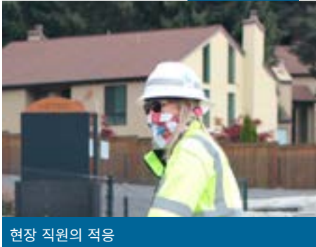
현장 직원의 적응