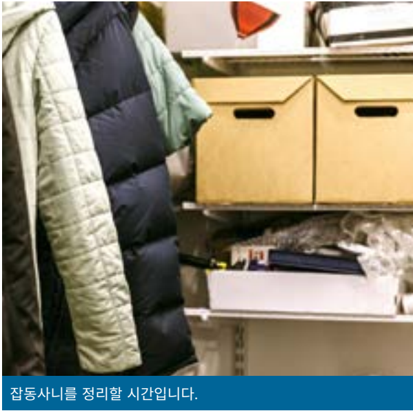
잡동사니를 정리할 시간입니다.

수집 장소를 이용하는 모든 고객은 이동 거리를 제한하고 안전한 거리를 유지해야 합니다. 이 정보에 대한 질문은 Bellevue Utilities recycle@bellevuewa.gov 로 문의해주세요.