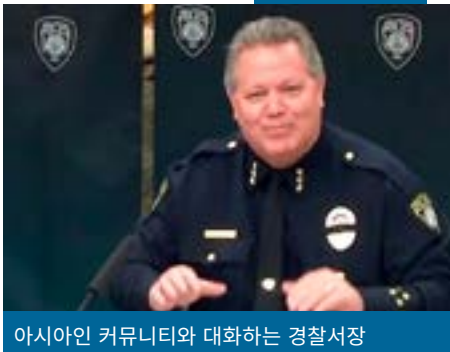
아시아인 커뮤니티와 대화하는 경찰서장

PRSR STD U.S. Postage PAID Bellevue, WA Permit No. 61